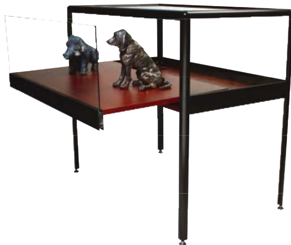
Vitrine table Prestige à tiroir coulissant

Dimensions : H 92 x L 103 cm. Profondeur : 60 ou 100 cm. Hauteur de présentation : 30 cm.